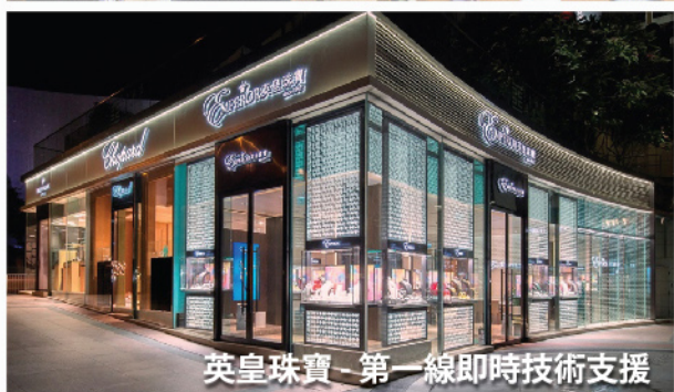
英皇珠寶 - 第一線即時技術支援