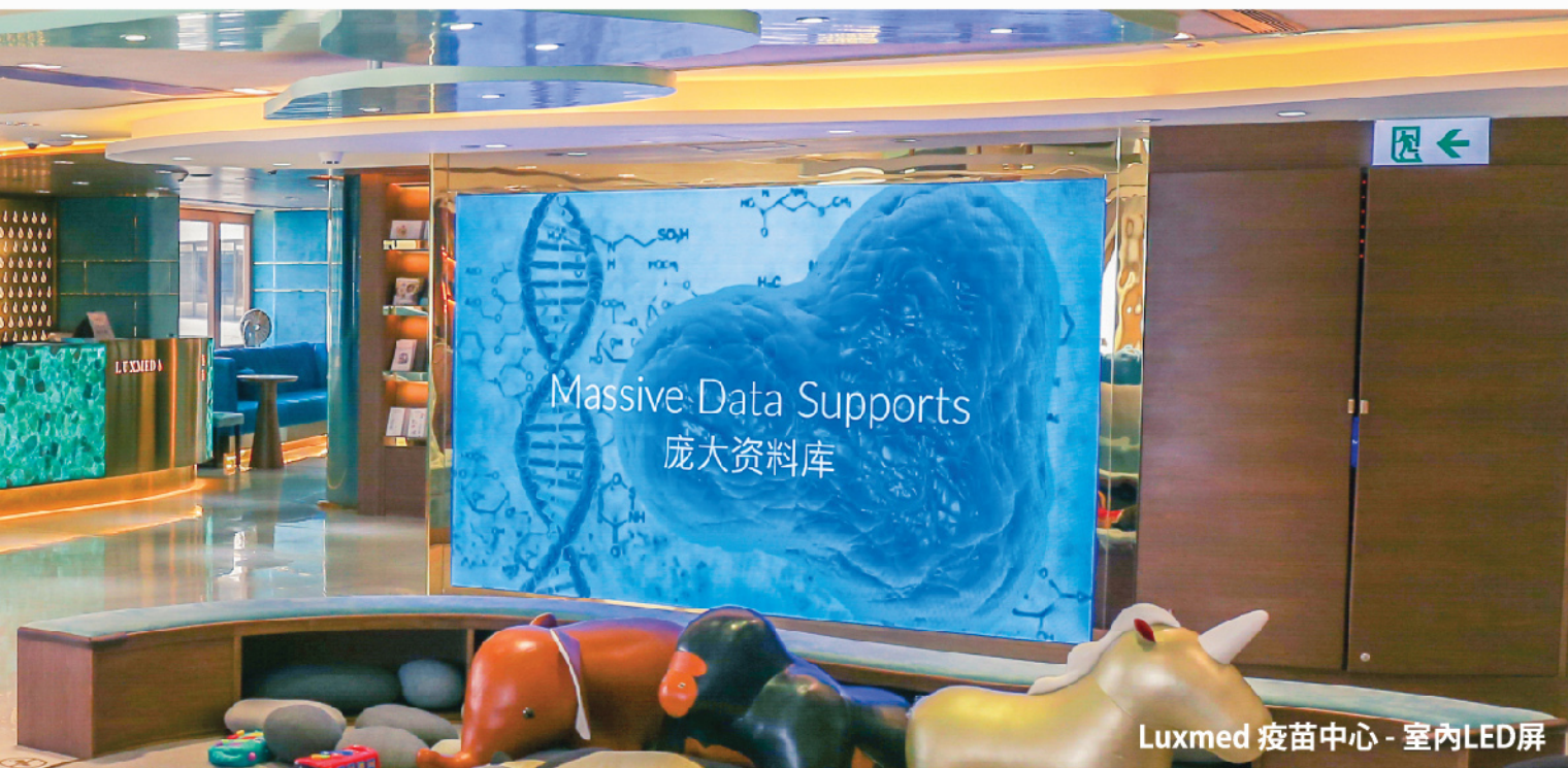
Luxmed 疫苗中心 - 室內LED屏