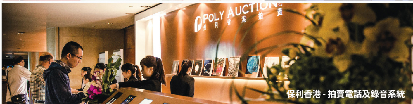
保利香港 - 拍賣電話及錄音系統