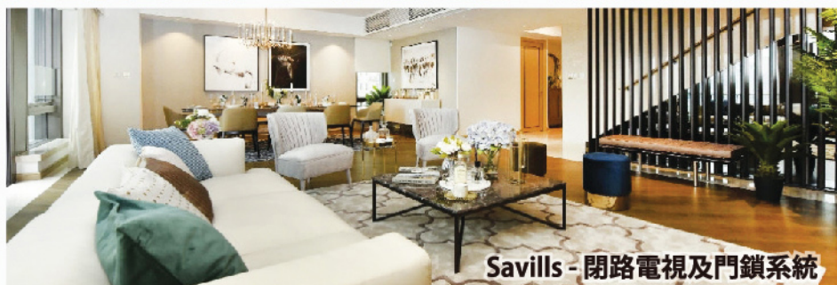
Savills - 閉路電視及門鎖系統