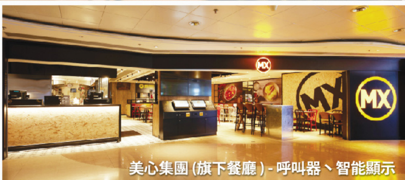
美心集團 (旗下餐廳) - 呼叫器、智能顯示