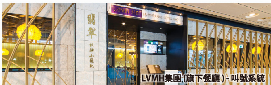
LVMH集團(旗下餐廳) - 叫號系統