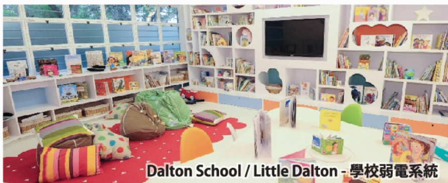
Dalton School / Little Dalton - 學校弱電系統