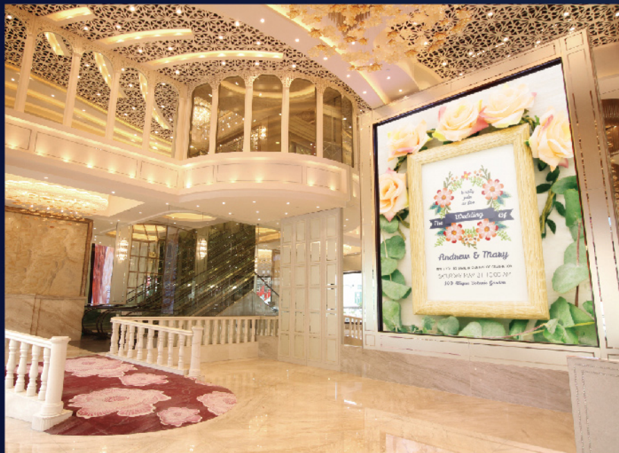
紅爵御宴 - 大型LED幕牆安裝工程