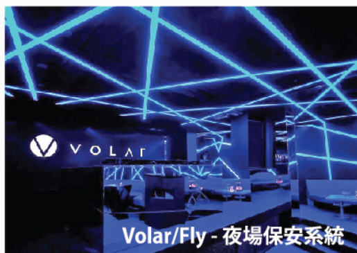
Volar/Fly - 夜場保安系統