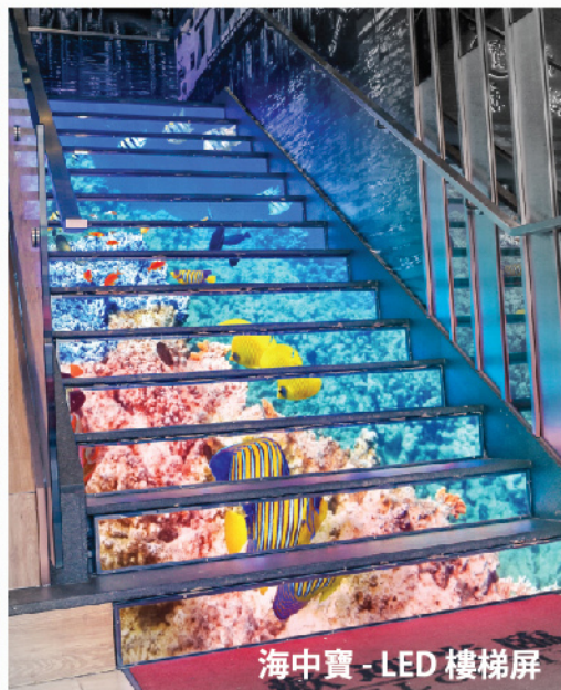
海中寶 - LED 樓梯屏